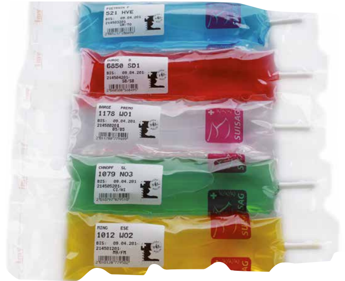
Abb. 1: Blister für die künstliche Besamung

Die künstliche Besamung ist eine effiziente Reproduktionsmethode. Beim Schwein wird mit Frischsperma, welches zwischen 3–6 Tage haltbar ist, gearbeitet. Der Einsatz von Tiefgefriersamen erfolgt für spezielle Zwecke wie gezielte Paarungen, Export/Import oder als Genreserve.