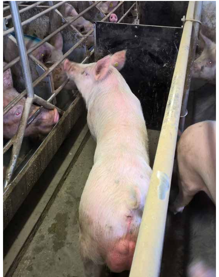
Abb. 3: Stimueber während der künstlichen Besamung

Deckgurt, Deckbügel oder Decksattel ermöglichen die parallele Besamung mehrerer Sauen, ohne dass die Besamungstechnik darunter leidet. Mit Besamungshilfen wird die Stimulation der Sau verbessert und die Dauer der einzelnen Besamung deutlich gesenkt.