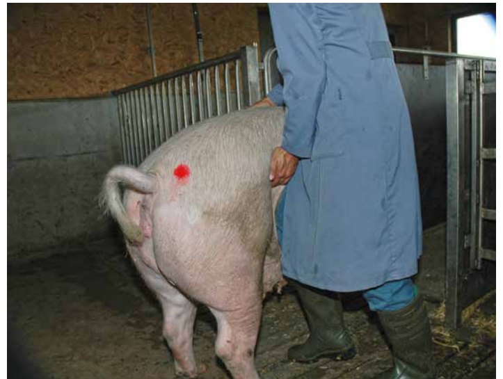
Abb. 2: Rauschekontrolle, Flankentest

Der Duldungsreflex lässt sich am besten auslösen, wenn der Mensch die nachstehend angeführten Verhaltensweisen des werbenden Ebers nachahmt: