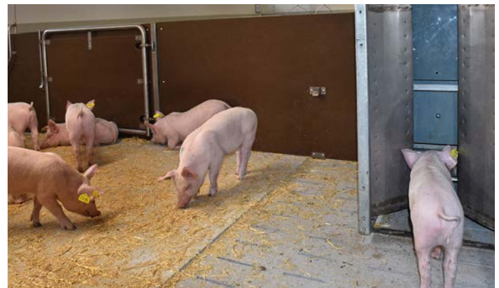
Illustr. 2: Saisie électronique de l'ingestion alimentaire

Des races du herd-book pures sont testées à l'épreuve par les collatéraux. Un groupe de collatéraux est composé de 2-5 frères et sœurs par portée. L'objectif est l'évaluation du potentiel de performance génétique des candidats d'élevage (collatéraux à l'exploitation d'élevage) en ce qui concerne la performance d'engraissement et d'abattage ainsi que la constitution.