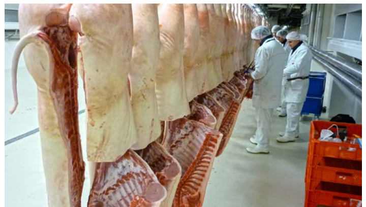
Illustr. 3: Relevé de données à l'abattoir

En plus de l'épreuve au centre de testage, on engraisse également des animaux dans des conditions axées sur la pratique et on les suit jusqu'à l'abattoir, afin de relever les données de l'abattoir et de les utiliser pour l'évaluation de la valeur d'élevage.