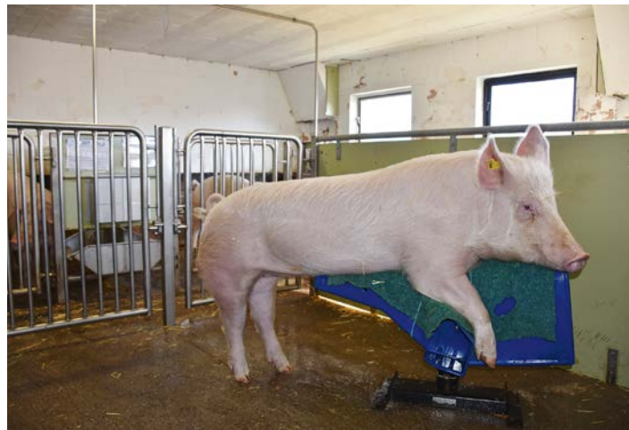
Illustr. 5: Entraînement de monte d'un verrat de la lignée maternelle en quarantaine