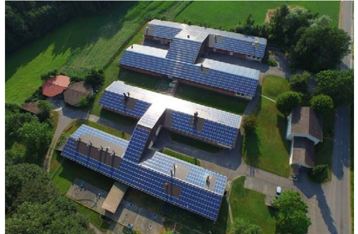
Illustr. 1: Centre de testage MLP, Sempach

Un laboratoire de viande est annexé au Centre MLP. Cette infrastructure permet de clarifier rapidement des questions en rapport avec les caractéristiques de sélection ou des questions axées sur la pratique des abattoirs ou transformateurs de viande.