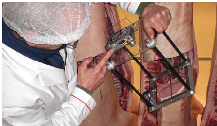
Illustr. 6: Mesure de la surface de la viande avec ScanStar

On fait une description linéaire pour tous les animaux de testage, resp. on mesure/compte les caractéristiques de 7 membres, de 4 tétines et de 2 types (cf. aide-mémoire „Epreuve sur le terrain“).