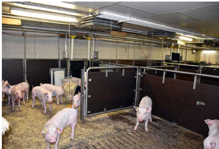
Illustr. 4: Elevage de verrats à Sempach

Depuis 2006, des candidats de verrats IA de la lignée maternelle sont élevés de manière centrale et testés. 2 à 3 frères de la même portée sont mis en place. A la fin de l'épreuve on relève de la prise de poids, de la charnure et on fait une description linéaire de la conformation. Les verrats les plus mauvais sont abattus et leurs caractéristiques de la carcasse sont saisies. Les meilleurs verrats sont transférés dans la porcherie d'attente. Une fois toutes les données de performances de tous les collatéraux des verrats en attente réunies, on décide définitivement, quels verrats seront utilisés – via quarantaine - pour l'IA. La sélection est très stricte. De tous les porcelets mâles mis en place, uniquement 10 % seront utilisés pour l'IA.