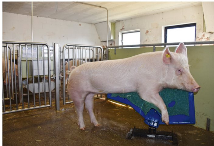
Illustr. 5: Entraînement de monte d'un verrat de la lignée maternelle en quarantaine