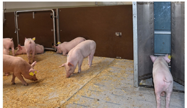
Illustr. 2: Saisie électronique de l'ingestion alimentaire

Des races du herd-book pures sont testées à l'épreuve par les collatéraux. Un groupe de collatéraux est composé de 2-5 frères et sœurs par portée. L'objectif est l'évaluation du potentiel de performance génétique des candidats d'élevage (collatéraux à l'exploitation d'élevage) en ce qui concerne la constitution, la performance d'engraissement, la composition de la carcasse ainsi que la qualité de la viande.