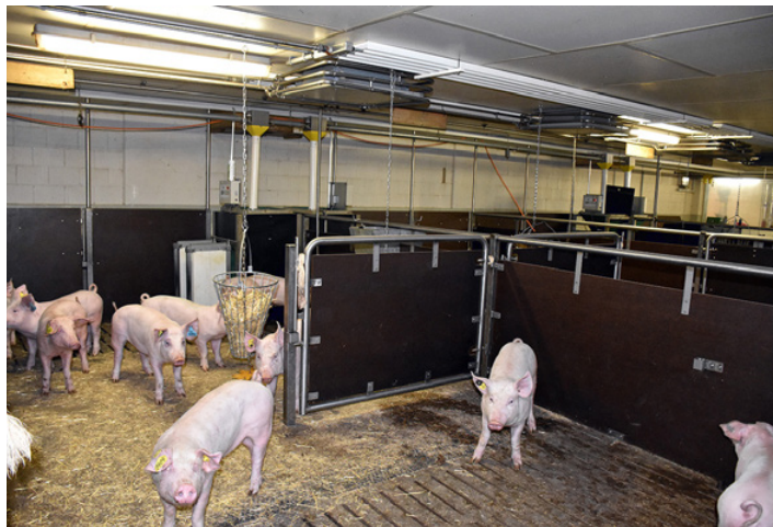
Illustr. 4: Elevage de verrats à Sempach

Depuis 2006, des candidats de verrats IA de la lignée maternelle sont élevés de manière centrale et testés. 2 à 3 frères de la même portée sont mis en place. A la fin de l'épreuve on relève la prise de poids, mesure la charnure par ultrason et effectue une description linéaire de l'extérieur. Les verrats les plus mauvais sont abattus et leurs caractéristiques de la carcasse sont saisies. Les meilleurs verrats sont transférés dans la porcherie d'attente. Une fois toutes les données de performances de tous les collatéraux de ces verrats en attente réunies, on décide définitivement, quels verrats seront utilisés – via quarantaine - pour l'IA. La sélection est très stricte. De tous les porcelets mâles mis en place, uniquement 10 % seront utilisés pour l'IA.