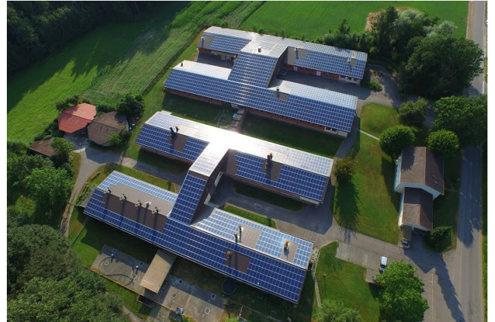
Illustr. 1: Centre de testage MLP, Sempach

Un laboratoire de viande est annexés au Centre MLP. Cette infrastructure permet de clarifier rapidement des questions en rapport avec les caractéristiques de sélection ou des questions axées sur la pratique des abattoirs ou transformateurs de viande.