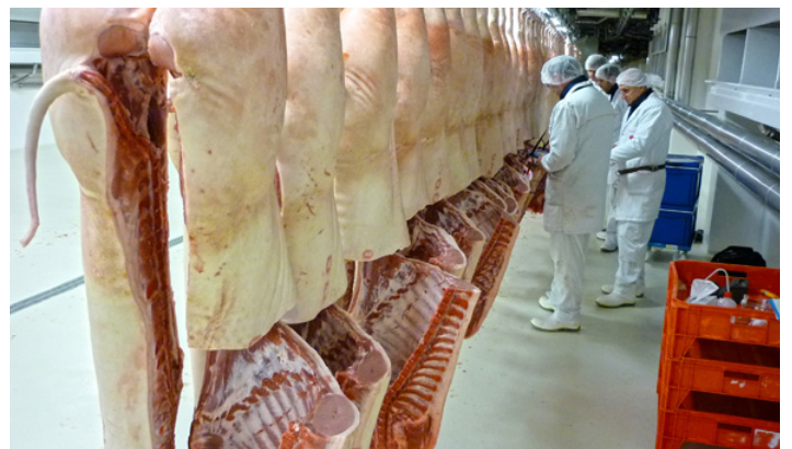
Illustr. 3: Relevé de données à l'abattoir

En plus de l'épreuve au centre de testage, on engraisse également des animaux dans des conditions axées sur la pratique et on les suit jusqu'à l'abattoir, afin de relever les données de l'abattoir et de les utiliser pour l'évaluation de la valeur d'élevage.